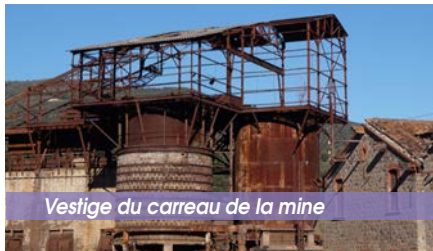
Vestige du carreau de la mine