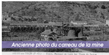
Ancienne photo du carreau de la mine

provenait principalement du site de Batère, perché plus haut sur les flancs montagneux (entre 1150 et 1700 m) du Pic St Pierre et du Pel de Ca. La matière première en descendait par un câble téléphérique long de 9 km jalonné de petits wagonnets suspendus. Une fois traité, le minerai partait par rail jusqu'à l'usine située juste à côté de la gare du chemin de fer desservant le Haut Vallespir depuis 1898 (l'actuelle gare routière). Le site est désormais dédié aux concerts de plein air (Cali s'y est notamment produit).