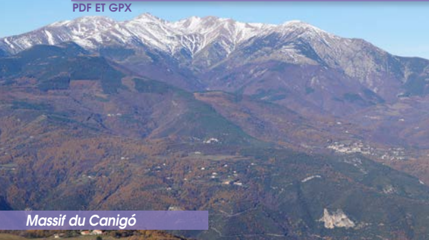
Massif du Canigó